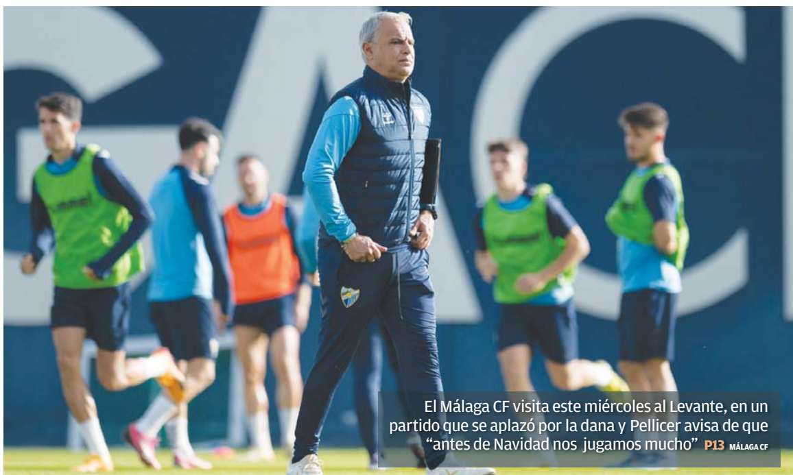
El Málaga CF visita este miércoles al Levante, en un partido que se aplazó por la dana y Pellicer avisa de que "antes de Navidad nos jugamos mucho" P13 MÁLAGA CF

PLUSVALÍA La reducción supone llegar a una bonificación del 25% por transmisiones mortis causa para no convivientes ALZA Suben Emasa, Parcemasa, las bodas civiles, Gibralfaro y Alcazaba ADEMÁS Se refuerza la aplicación de beneficios fiscales en apoyo a la actividad económica, el empleo y el fomento de la construcción de VPO