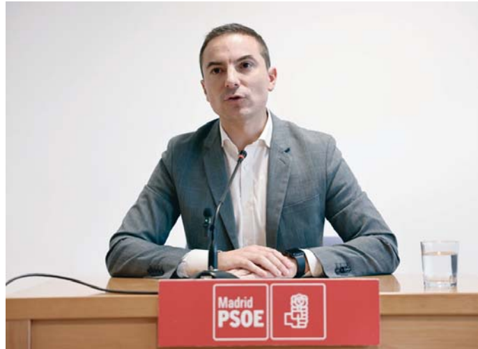
El secretario general del PSOE-M, Juan Lobato, durante su comparecencia ante los medios.