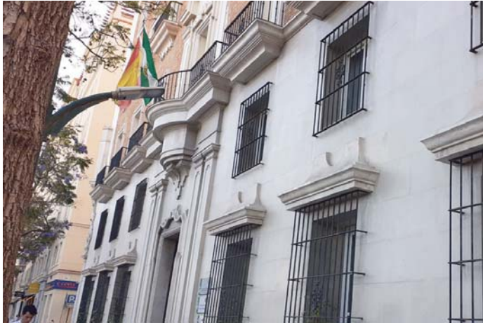
Sede del alto tribunal andaluz en la capital malagueña.