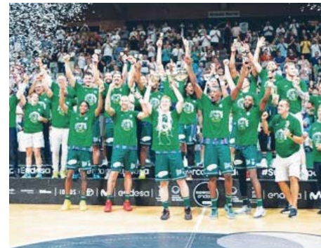
El Unicaja Málaga levantando el trofeo de la Supercopa.