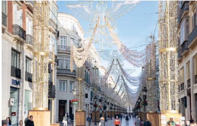
Así luce Calle Larios con todo a punto para el estreno de la iluminación.

Se encenderá por primera vez esta Navidad este viernes 29 de noviembre, a partir de las 18.30 horas en la entrada de ca-