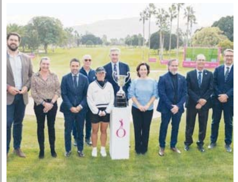
Presentación del Open de España 2024. DIPUTACIÓN DE MÁLAGA

GOLF Del 28 de noviembre al 1 de diciembre