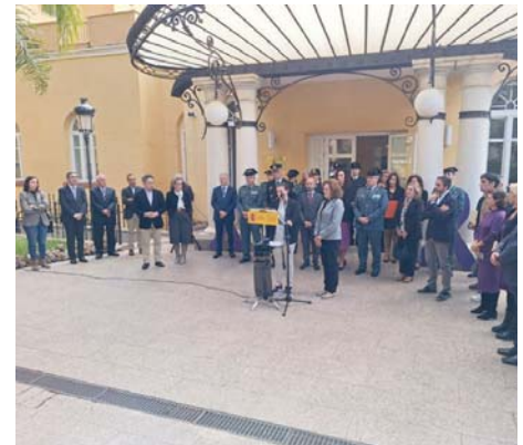
Acto institucional en la Subdelegación del Gobierno. VM

Asimismo, hasta el 30 de junio de este año 2024, se habían adoptado 697 órdenes de protección por órganos judiciales y se habían producido 4.296 denuncias por violencia de género en el ámbito judicial.