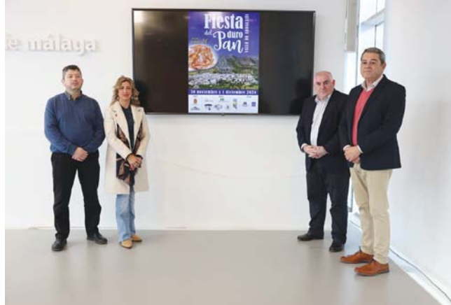
La guía ha sido presentada en este lunes en Málaga. DIPUTACIÓN

"Con la celebración de este evento se pretende poner en valor la cocina de aprovechamiento, para evitar el desperdicio de alimentos, y contribuir con ello al desarrollo sostenible, además de revitalizar la actividad panadera