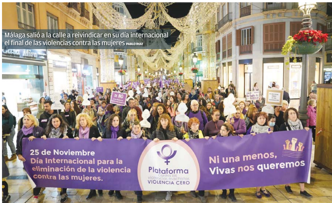
Málaga salió a la calle a reivindicar en su día internacional el final de las violencias contra las mujeres PABLO RUIZ

DATOS TRISTES Desde el año 2003, que hay registros, han sido 57 las mujeres asesinadas en la provincia VIOLENCIA También ha quitado la vida a tres menores y dejado huérfanos a otros 20 en la provincia desde 2013 TODOS Ayuntamientos, Junta, Diputación y Subdelegación han organizado actos en homenaje a las víctimas