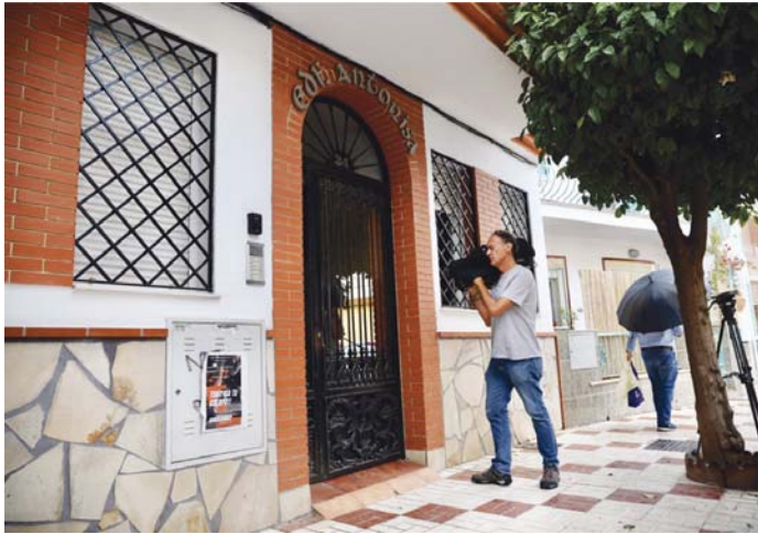
Un cámara graba en la puerta de la casa donde se produjo el asesinato machista de Paula.

El acusado comentaba públicamente que ella estaba "muy depresiva", pero lo cierto